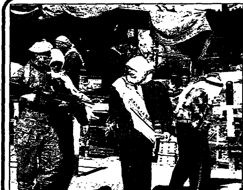
الجنود الاسرائيليون في سوق الخليل وايديهم على زناد الرشاشات